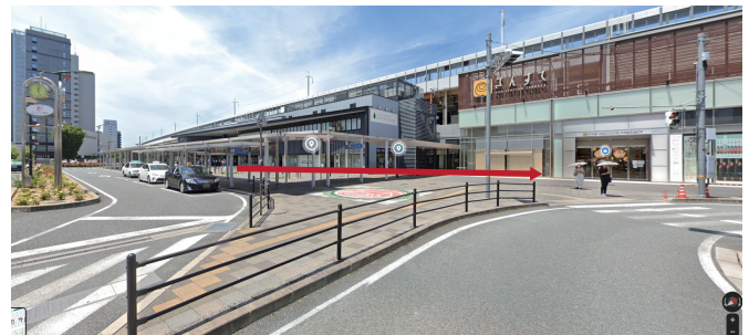
福山駅“南口”を出て左手に進む